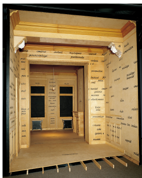
Marcel Broodthaers, Salle blanche , 1975

11 octobre, 15 novembre, 20 décembre, 24 janvier, 28 février, 4 avril