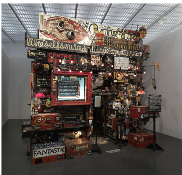
Ben, Le magasin de Ben , 1958-1973

1 er novembre, 6 décembre, 10 janvier, 14 février, 21 mars, 25 avril