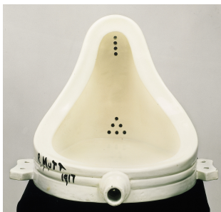
Marcel Duchamp, Fontaine , 1917/1964

18 octobre, 22 novembre, 27 décembre, 31 janvier, 7 mars, 11 avril